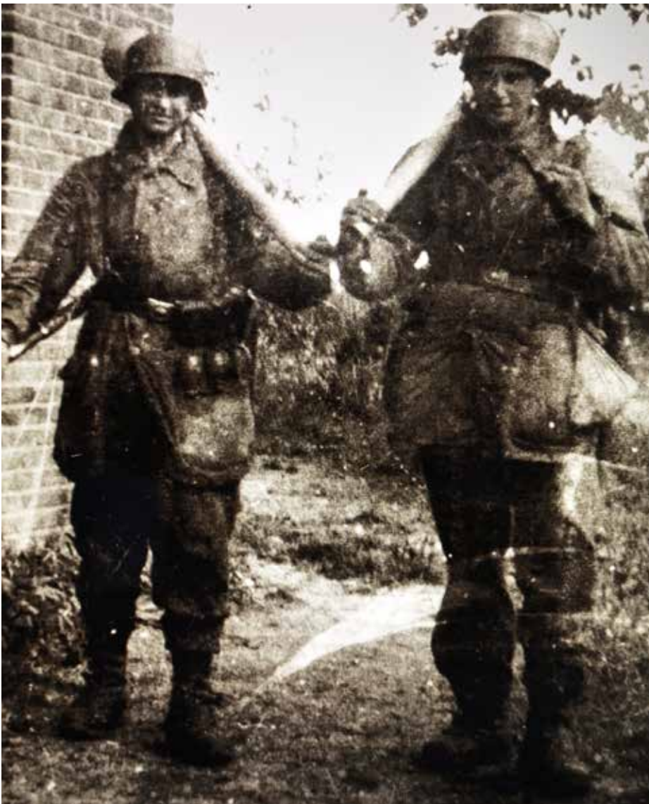
Afb. 3. Twee zwaarbewapende Duitse soldaten in de Meijelse Molenstraat. Ze zouden enkele uren later sneuvelen. Hun namen zijn onbekend. Mogelijk hebben beiden op het kerkhof aan de Astenseweg gelegen en rusten ze nu in Ysselsteyn.