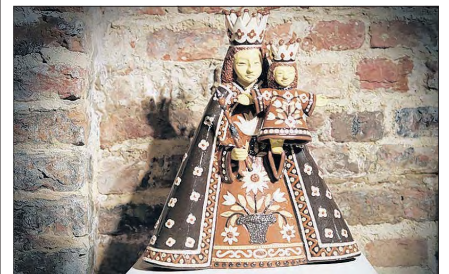
Replica Maria met Kind in Keramiekmuseum in Tegelen.

Het Keramiekkentrum Tiendschuur Tegelen is te vinden aan de Kasteellaan 8, tel. 077-3260213 ( www.tiendschuur.net ). Open van di 1/m za van 14-17 uur, zo van 11-17 uur.