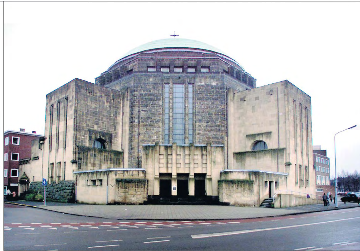
De Koepelkerk in Maastricht geldt als een daad van jeugdige overmoed