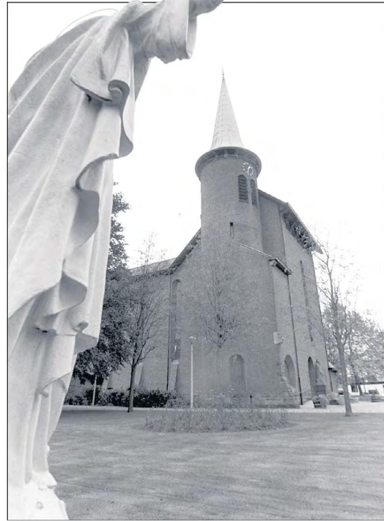
De Sint Hubertuskerk in Genhout is een van Boostens architectonische hoogtepunten (I)